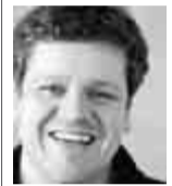
VON CHRISTIAN BOS

Wir haben mal gewartet. So beklagen The Arcade Fire auf ihrem aktuellen Album unsere Instant-Gesellschaft. Alles muss im Augenblick geschehen, jeder Augenblick mit Inhalt aufgefüllt werden. Wir warten nicht auf den Bus: Wir schicken eine SMS, spielen ein Online-Spiel, hören MP3s und aktualisieren unser Facebook-Profil. Nach einer Studie der britischen Medienaufsichtsbehörde verbringen die Menschen durchschnittlich 45 Prozent ihrer Wachzeit mit der Nutzung von Medien. Immer häufiger halten sie dann mehrere Kanäle gleichzeitig offen. Stumm läuft der Fernseher, während die Musik spielt und das Internet Auskunft über die medialen Erlebnisse der „Freunde“ gibt.